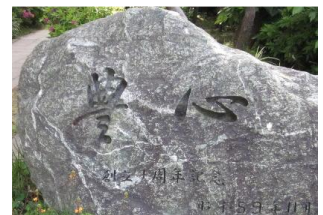
上-グラウンドよりの校舎全景 中左-校門付近 中右-「豊心」の碑 下-小学生と一緒にクリーン活動