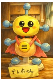
伝え合うキャラクター

そして、 勇気ある言葉をたたえる こと。そんな『ひなたぐち』が広がる西山田小の掲示板には実際に友だちから『ひなたぐち』の言葉をかけてもらったエピソードが学年ごとにたくさん貼られています。そんな掲示を見るだけで、心が癒される毎日です。言葉は目には見えませんが、 人の心をあたためる大きな力 を持っていることを実感します。