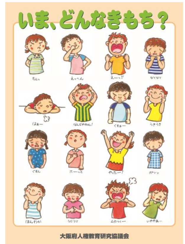
大阪府人権教育研究協議会

ポスターには16の気持ちが載っていますが、本当はそれ以上にいろいろな感情があるはずで、語彙が少ない子どもには「また“チクチク虫”が出てきた」とか「今の気持ちは“フカフカじゅうたん”だよ」というように「今の気もちに名前を付けてごらん？」と名前を付けさせることも有効です。「やばい」「ムカつく」のように簡単な言葉で済ませてしまっていますが、名前をつけることでより自分の気持ちに向き合うことができます。「いまどんなきもち」のポスターは、大人教（大阪府人権教育研究協議会）のHPからもダウンロードできます。ご家庭でもぜひお試しください。