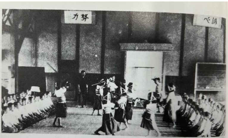
明治42年9月落成の雨中体操場 *正面左右に「誠心」「努力」の2つの額が掲げられています。