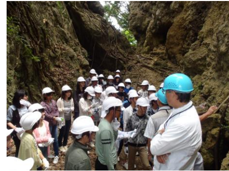
ガマ見学・平和記念公園