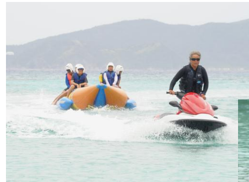
渡嘉敷島 マリンスポーツ