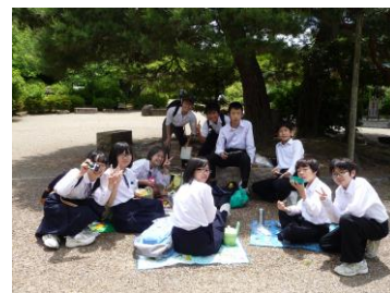
丸山公園でお弁当!