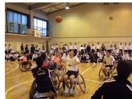
人権講演会(パラリンピックキャラバン交流会)