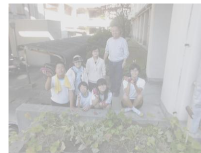
支援学級 サツマイモの収穫