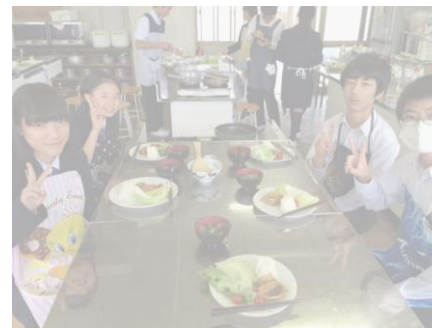
2年家庭科調理実習(豚肉のショウガ焼き)