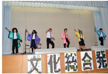
生徒会オープニング