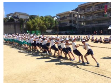
小・中交流 綱引き