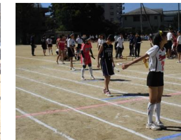
クラブ対抗リレー