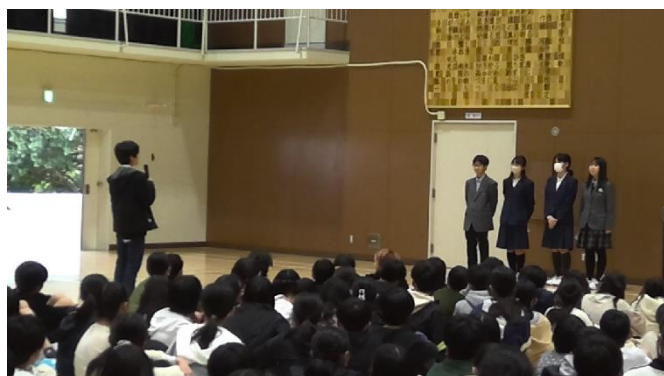
2月22日 生徒会 委員会紹介(6年生へ)