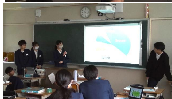
2月中旬 2年生 英語プレゼンテーション