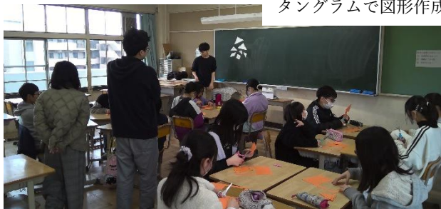
タングラムで図形作成