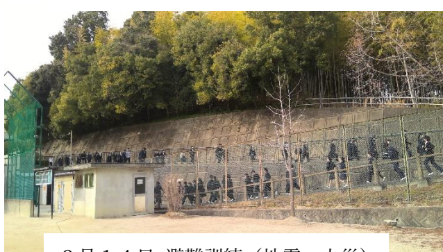
2月14日 避難訓練 (地震・火災)