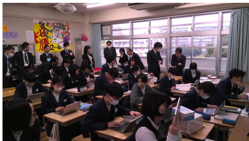
2月5日 府教委・市教委 “英語授業視察”