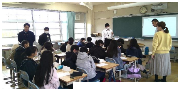
英語で中学校生活を知ろう