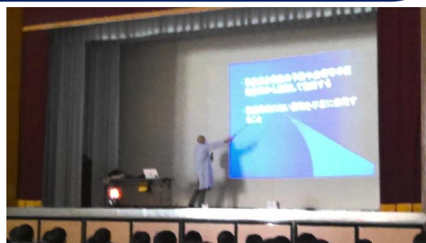
2月8日 1年生 “薬物乱用防止教室”