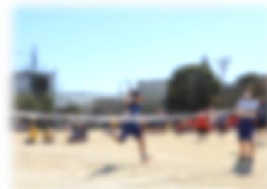
↑栄光のゴール！おめでとう！