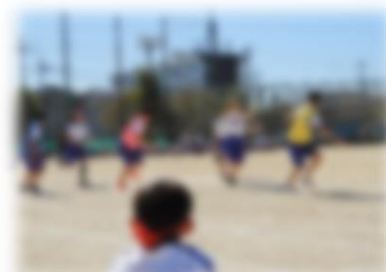
↑アンカーへのバトンパス。頑張れ！