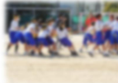
↑1年学年種目ポールボール。劣勢からの…