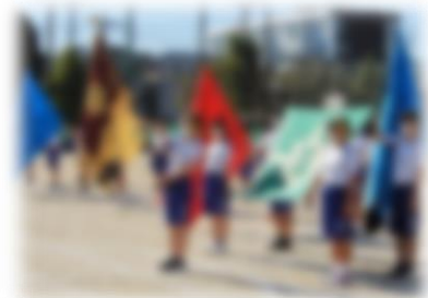
↑開会式。生徒会役員が旗手を務めました。