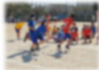
↑バトンパスで一歩リード。まだこれから！