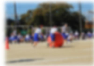
↑新種目、大玉ころがし。ナイスコロコロ～!!