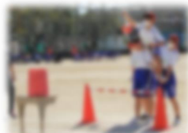
↑2年学年種目 ローハイド