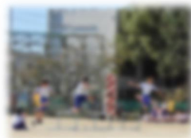
↑ハードル走から競技スタート！