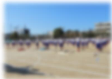
↑緊張感が漂っています…