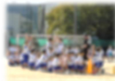
↑優勝決定の瞬間です。バンザイ！