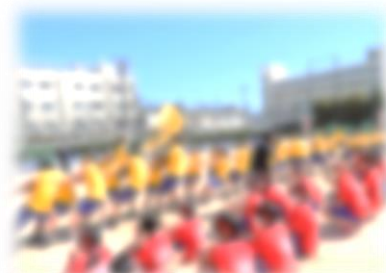
↑大盛り上がりの綱引き。