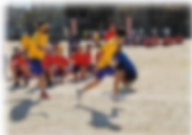
↑3年学年種目 全員リレー