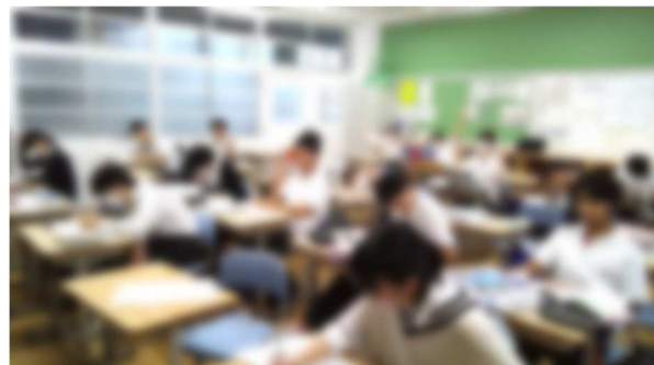
1組に撮影に行ったら、顔が上がってしまいました…集中！