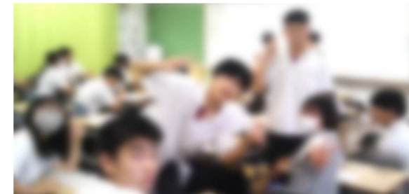
2,3組の体育委員さんのかっこいい姿をまた撮りにいきます！！📷