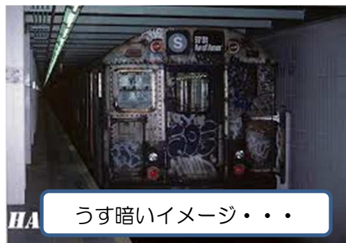
うす暗いイメージ・・・