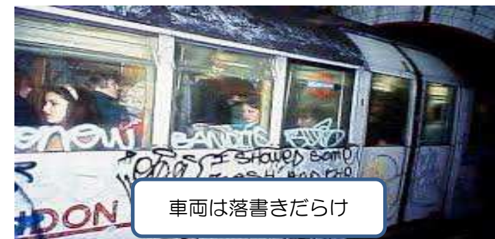
車両は落書きだらけ