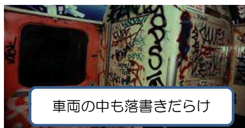
車両の中も落書きだらけ