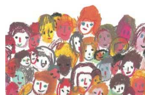
『世界がもし100人の村だったら』

If the world were a village of 100 people 世界がもし100人の村だったら