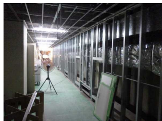
体育館前廊下工事