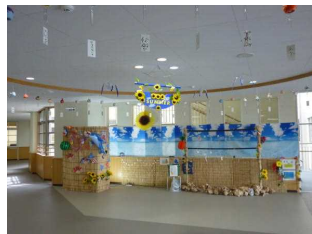
夏飾り（玄関ロビー）