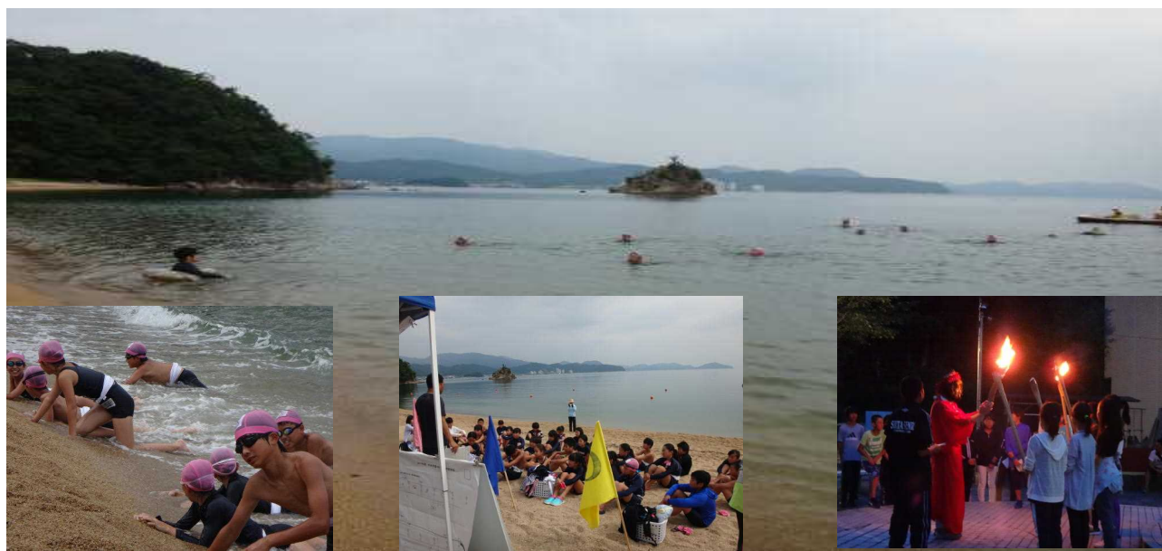
今年も天候にも恵まれ、予定していたプログラムを全て行うことができました。