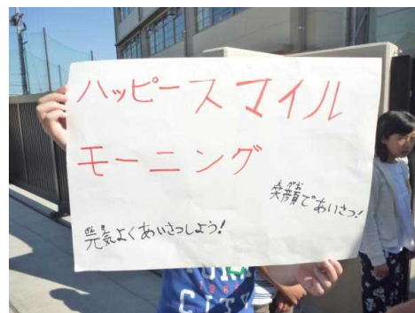
「おはようございます」

毎朝、児童会の児童が校門前であいさつ運動を展開中。27日からは小中合同あいさつ運動がはじまりました。