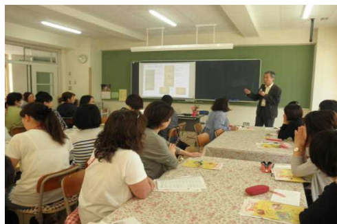
「お弁当の日」講演会の様子