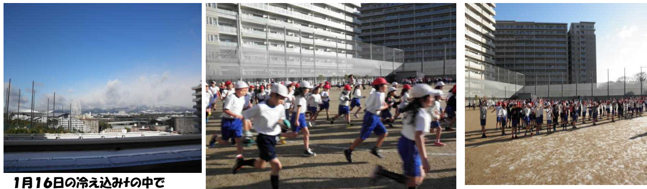
1月16日の冷え込みの中で

1月18日(水)になわとび集会が開催されました。また、月曜日と金曜日はマラソンタイムがあり、それぞれが自分との勝負ををしていました。