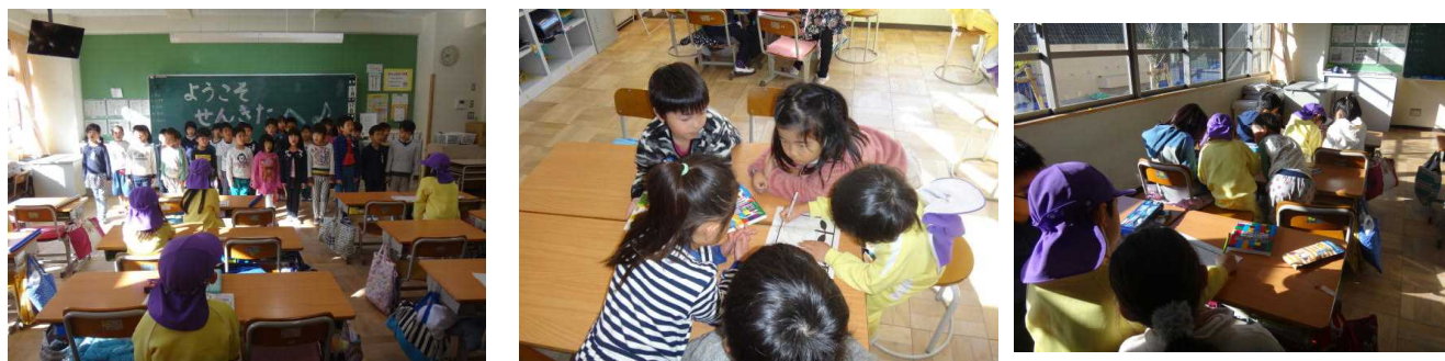
歓迎の気持ちを込めて、校歌を披露したり、折り紙・ぬい絵等で楽しみました。