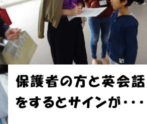
保護者の方と英会話をするとサインが・・・