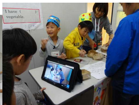
今年はICT機器も使って説明