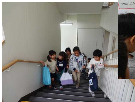
異年齢グループでショッピングスタート

今年から、吹田市の研究指定校として「使って楽しめる英語-ICT機器を活用して」をテーマとして、取組を進めています。その取組の一環として、オープンスクール時に保護者のお力も借りて、外国語活動を「GO GO Market」として取り組みました。2年生「ビタミンジュースショップ」3年生「動物さがし」「アニマルランド」、4年生「スポーツバスケット」「めざせ、スポーツクイズ王」5年生「英語カルタ」「Make your own Monster」、6年生「ジャパネット6の1(祭り)」として、それぞれがショップを開き、お互い英語で会話することに取り組みました。保護者の皆様も英語での対応ありがとうございました。これからは、もっと気軽に英語が使える児童になってほしいと思います。