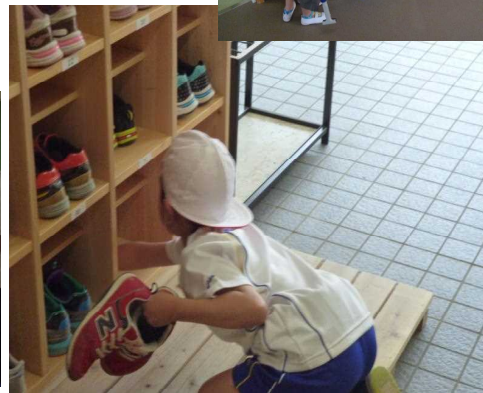
靴箱のすみっこまで!