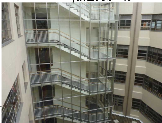
ガラス張りの 中央階段