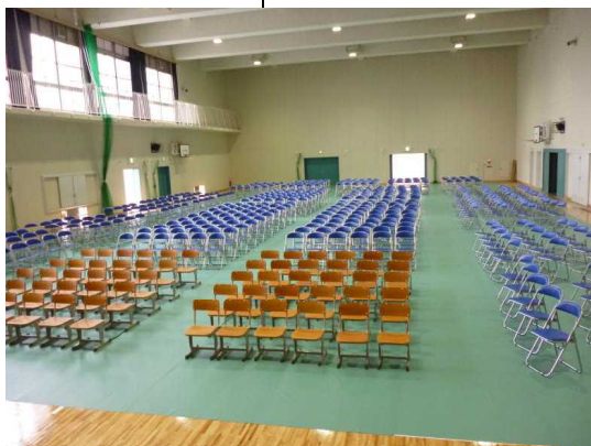
開校式・入学式会場