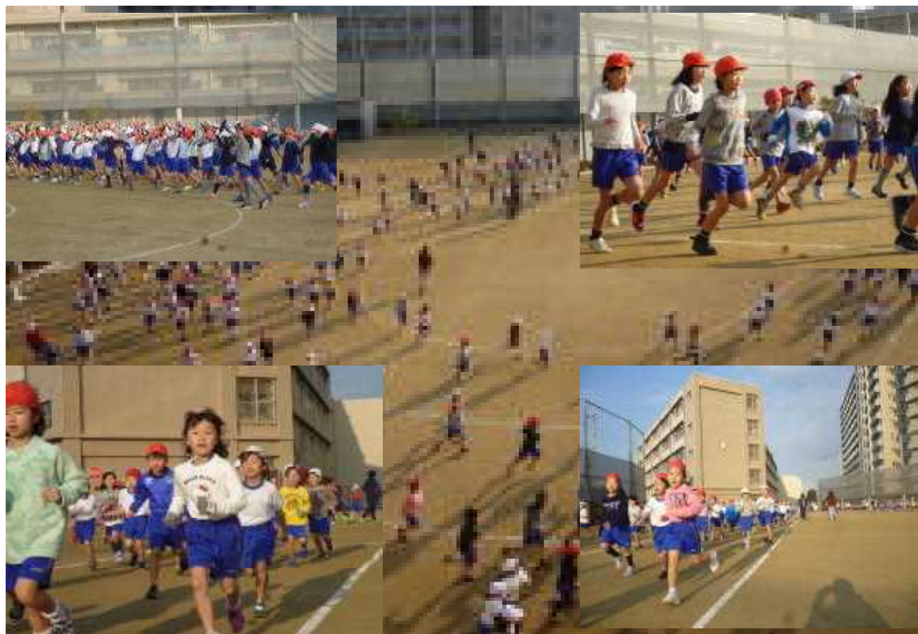
スマイル体操からはじまって、1周はみんなでウォーミングアップ、その後、自分のペースで5分間走っています。

1月16日（火）からマラソンタイムがスタートしました。寒空の中ですが、子どもたちは一生懸命がんばっています。今年のマラソン大会では、良い記録ができることでしょう。