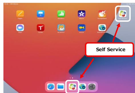
iPadホーム画面 (イメージ)