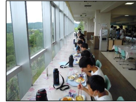
食事は同じ方向を向いて黙食