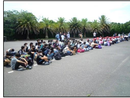
入所式は西山田小と一緒に行了きました