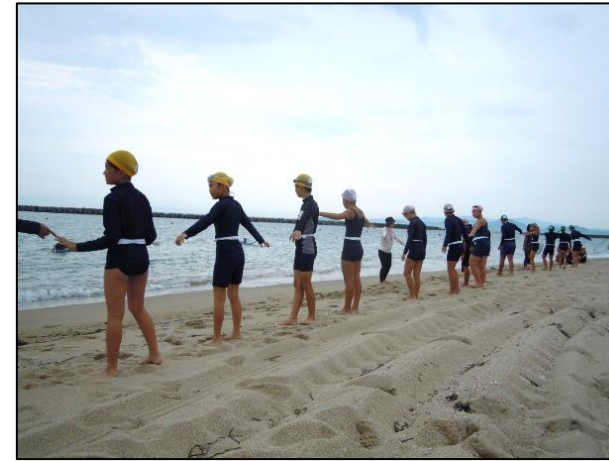
間隔をあけて水慣れをします