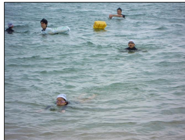
ちょっとドキドキ…