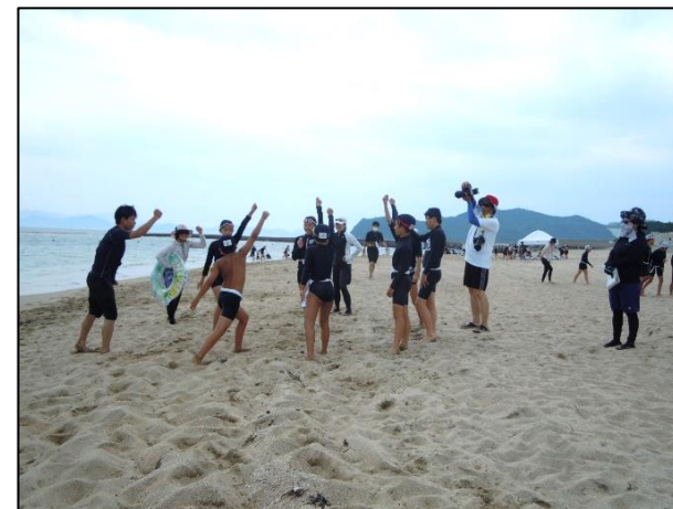
今までの練習の成果を発揮できました！