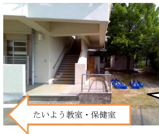
たいよう教室・保健室

なお、出席された際に植木鉢をお持ち帰りください(夏休みにホウセンカの観察の宿題 があります)。出席されない場合は、ご都合の良い日にお持ち帰りください。