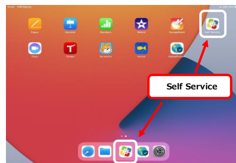
iPadホーム画面 (イメージ)