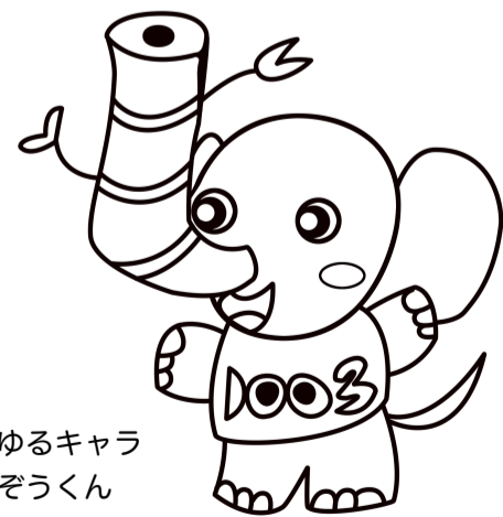
創立50周年ゆるキャラ せんりたけぞうくん