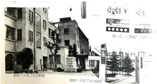
昭和14年ごろの校舎

……「コンクリート造」だけに、どんな教室かと思った。はじめて中にはいった。りっぱだ。こうどうには、ピアノがあり、地下室もある。中には、げたばこ、かさたて、カップかけがある。前から先生にきいていた鉄道は、「阪急」のようだ。ぼくらの教室は、さらできれいだ。横にはものおきがある。電とうは、丸いかさにつつまれて、大へんきれいだ。手工室、理科室、しょう歌室、図画室などぼくらのためにもうけられた多くの室がある。ふつうの教室も前とはくらべものにならない。第一明るい。そうじのときに、ゴミをすてるにも新しいせつびがなされている。その他いちいちかぞえきれない。……。