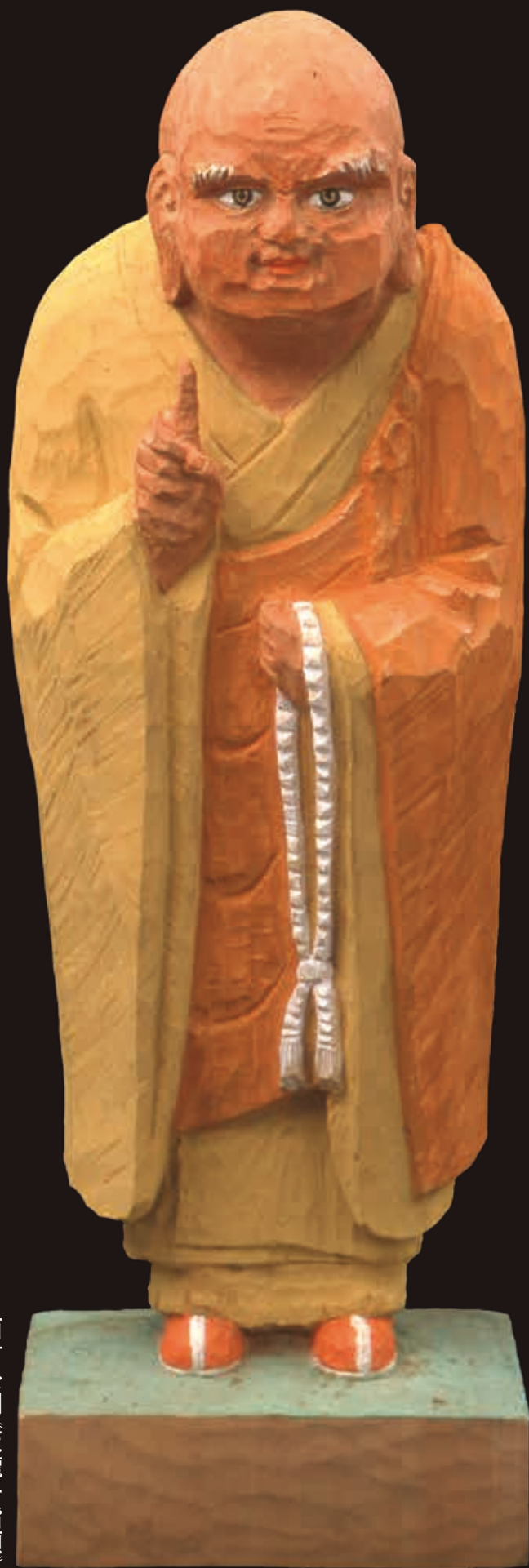
西村公朝《天龍一指頭》