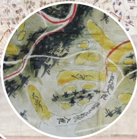
木がうっそうと繁る津雲台あたり 摂津国島下郡山田中村絵図(当館蔵)

江戸時代になると様々な絵図が作成されるようになりました。幕府や領主の命令によって作成される絵図もあれば、水利や山論などの打合せや取り決めの際に利用するため村々で作成する絵図もあります。昔の吹田の人々が生活した空間、生活した景観をすることができる絵図の世界を紹介します。